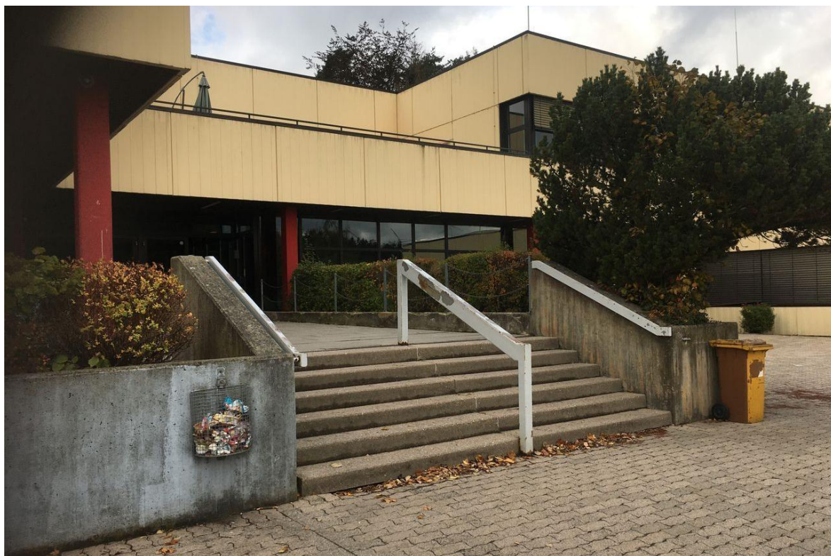
Zugang zum Haupteingang