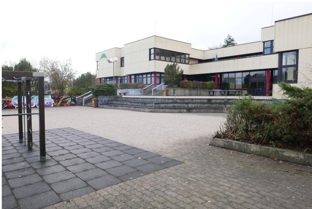
Ansicht von der Ostseite (Pausenhof)