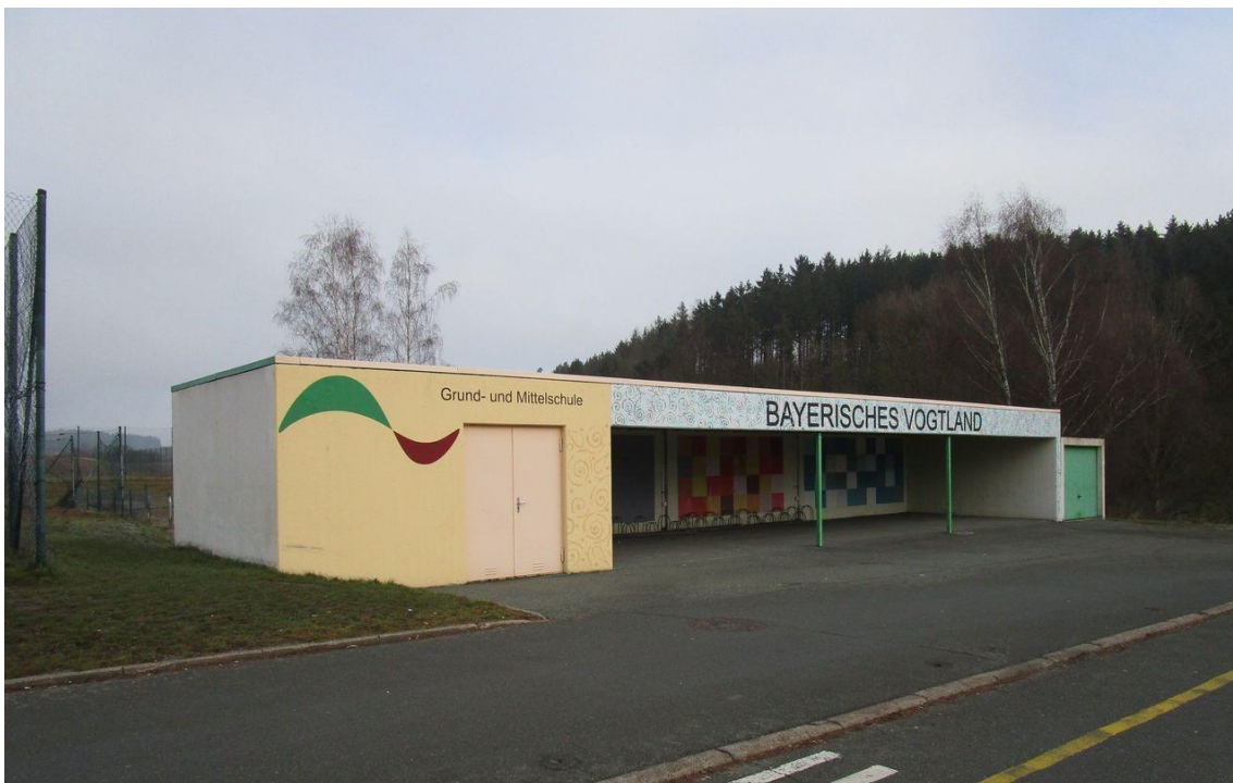
Fahrradunterstand – Buswendeplatz