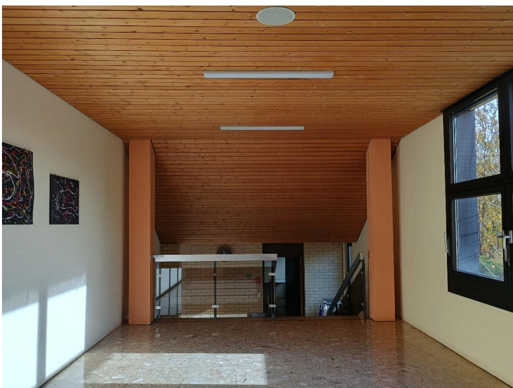
Übergang Turnhalle - Innenbereich