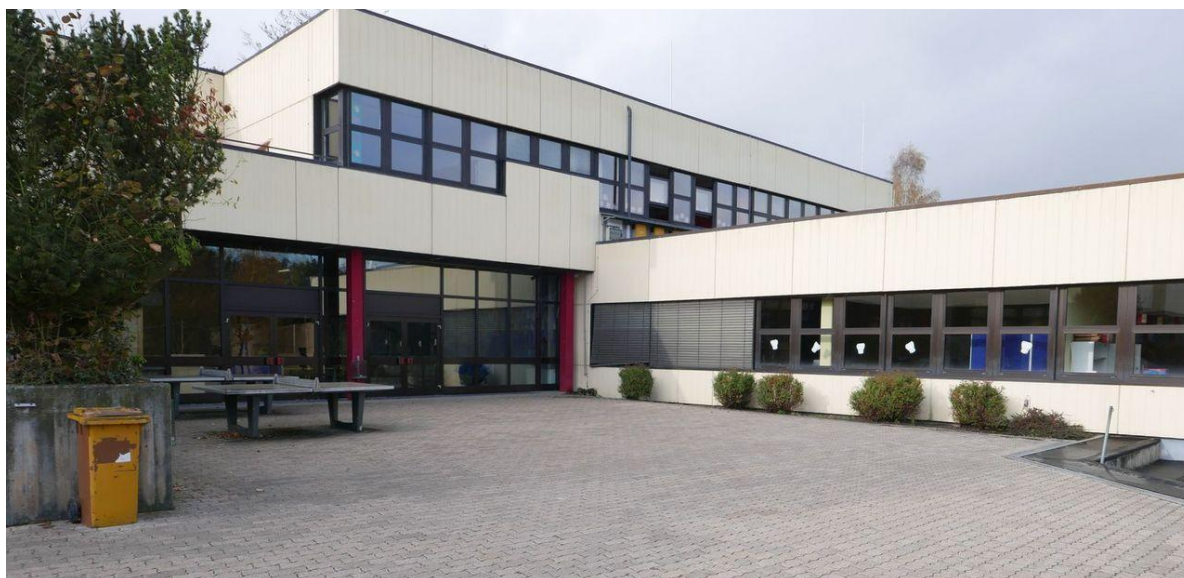
Pausenhof – obere Ebene