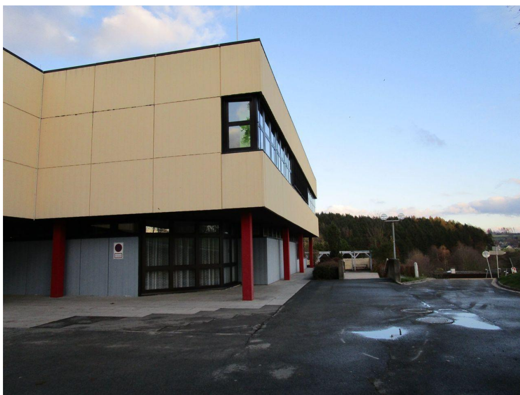
Ansicht von Süden (Zufahrt Lehrerparkplatz – Steinweg)