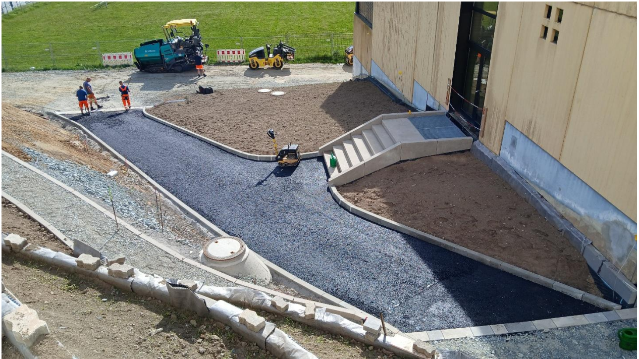
Während der Baumaßnahmen ist die im 1.BA neu hergestellte Außenanlage an der Nordseite der Turnhalle zu schützen.