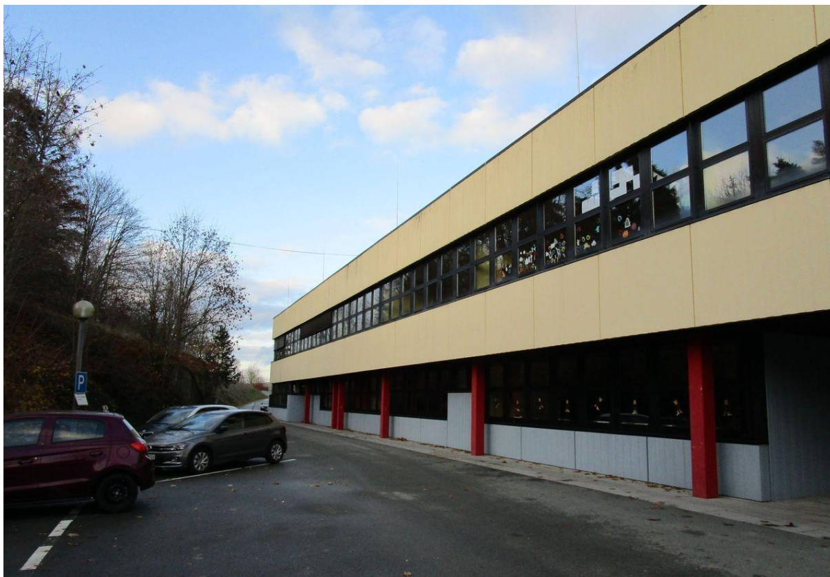
Ansicht Westen (Lehrerparkplatz – Steinweg)