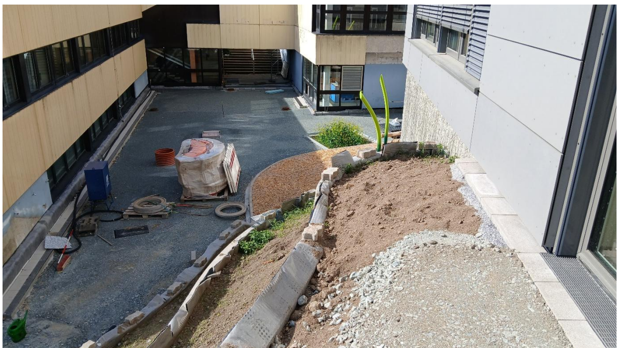
Während der Baumaßnahmen ist der im 1.BA neu hergestellter Pausenhof an der Westseite der Turnhalle zu schützen.