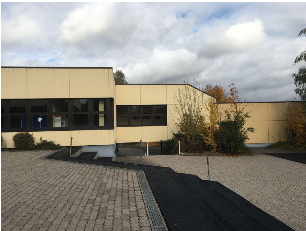
Übergang Turnhalle – Ansicht vom Pausenhof