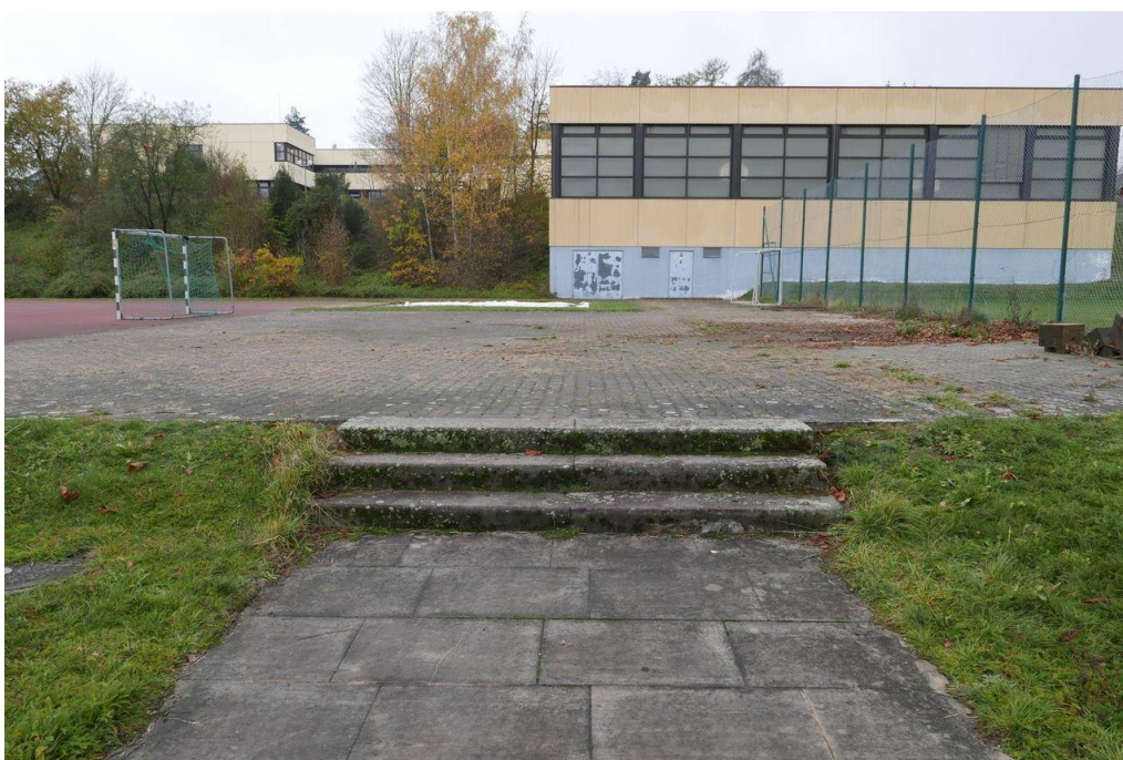
Ansicht Turnhalle von der Ostseite